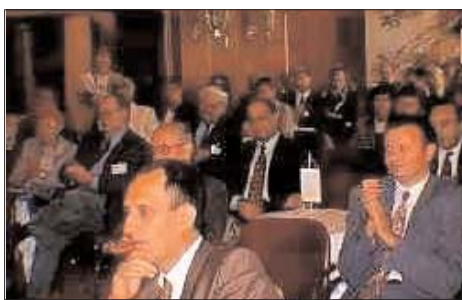
Sa jubilarne, Desete konferencije, 1998