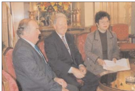
Zvanični predstavnik Saveta Evrope na VII konferenciji, 1995