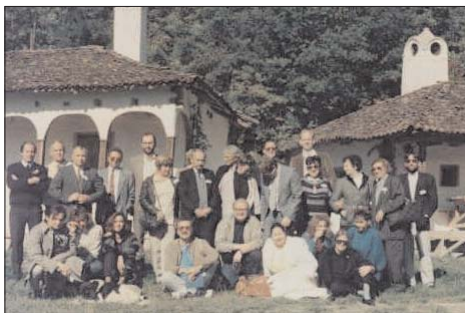
Učesnici Prve konferencije na putu za Kladovo, 1989