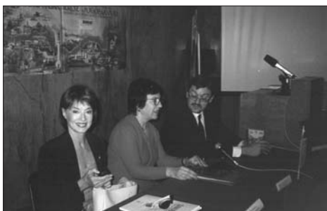
Sa otvaranja Osme konferencije, 1996