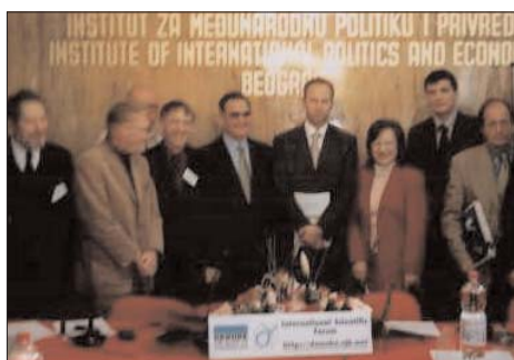
Ministar trgovine, turizma i usluga svečano otvorio XIV konferenciju, 2003